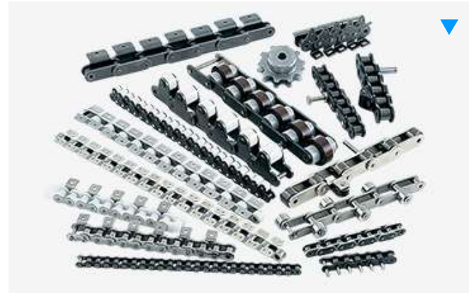
プラスチックモジュラーチェーン