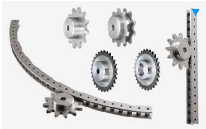
タイミングベルト・タイミングプーリ