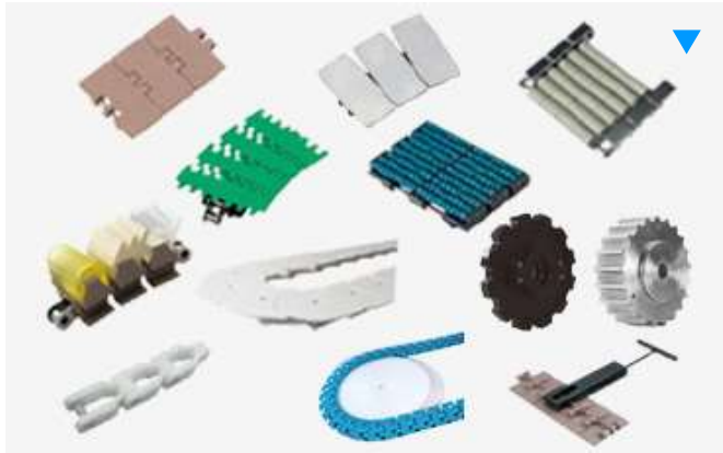
スプロケット・ピンギヤドライブ