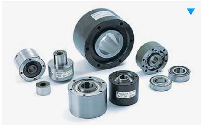
機械式過負荷保護機器