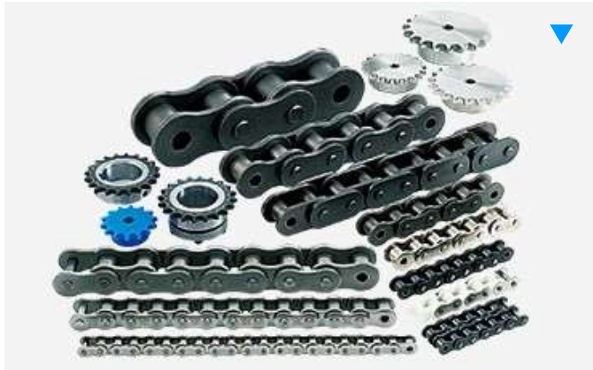
大形コンベヤチェーン